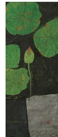
左・三葉つつじ 右・蓮池