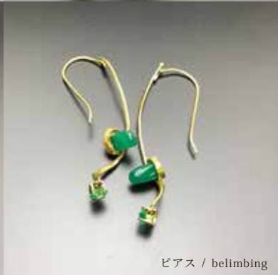
ピアス / belimbing