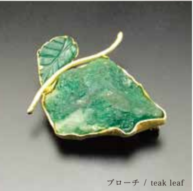
ブローチ / teak leaf