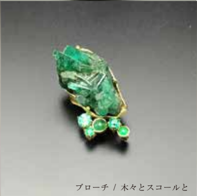
ブローチ / 木々とスコールと