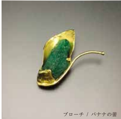
ブローチ / パナナの蕾