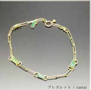
ブレスレット / rantai