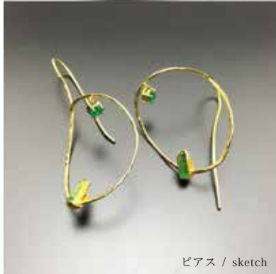
ピアス / sketch