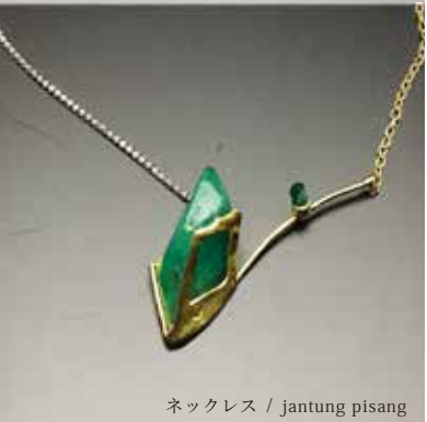
ネックレス / jantung pisang