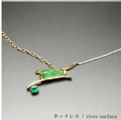
ネックレス / river surface