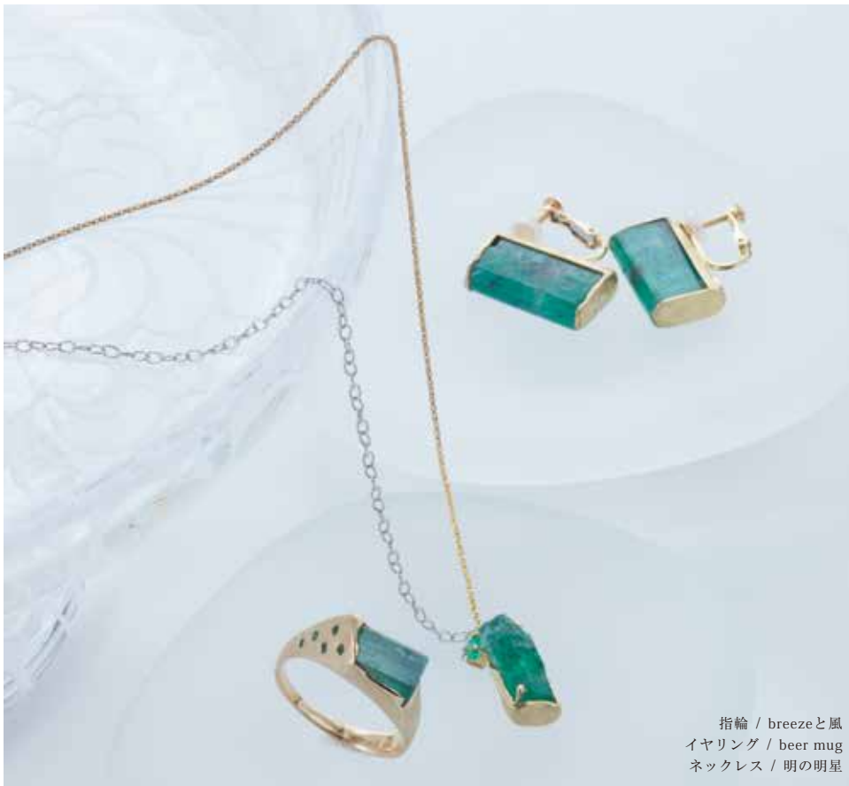
指輪 / breezeと風 イヤリング / beer mug ネックレス / 明の明星