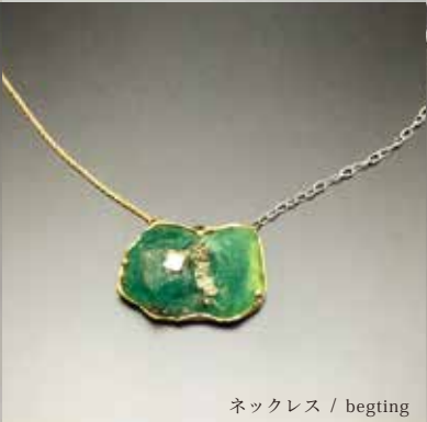
ネックレス / begging