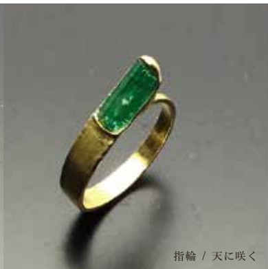
指輪 / 天に咲く