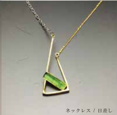
ネックレス / 日差し