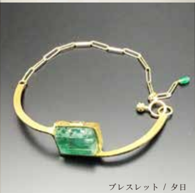
ブレスレット / 夕日