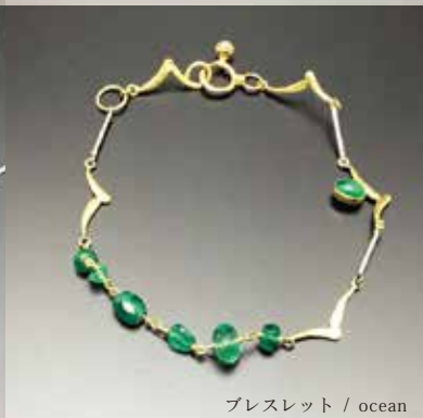
ブレスレット / ocean