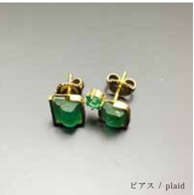
ピアス / plaid