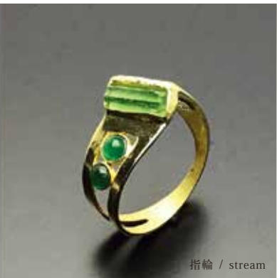
指輪 / stream